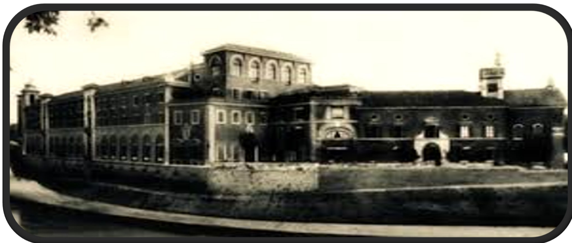
Ospedale Fatebenefratelli 1943

La natura ritrova il suo spazio. L'inquinamento diminuisce e cieli e mari sembrano più limpidi. E la natura! Spesso nascosta, qualche volta sopraffatta, ma mai realmente estinta,