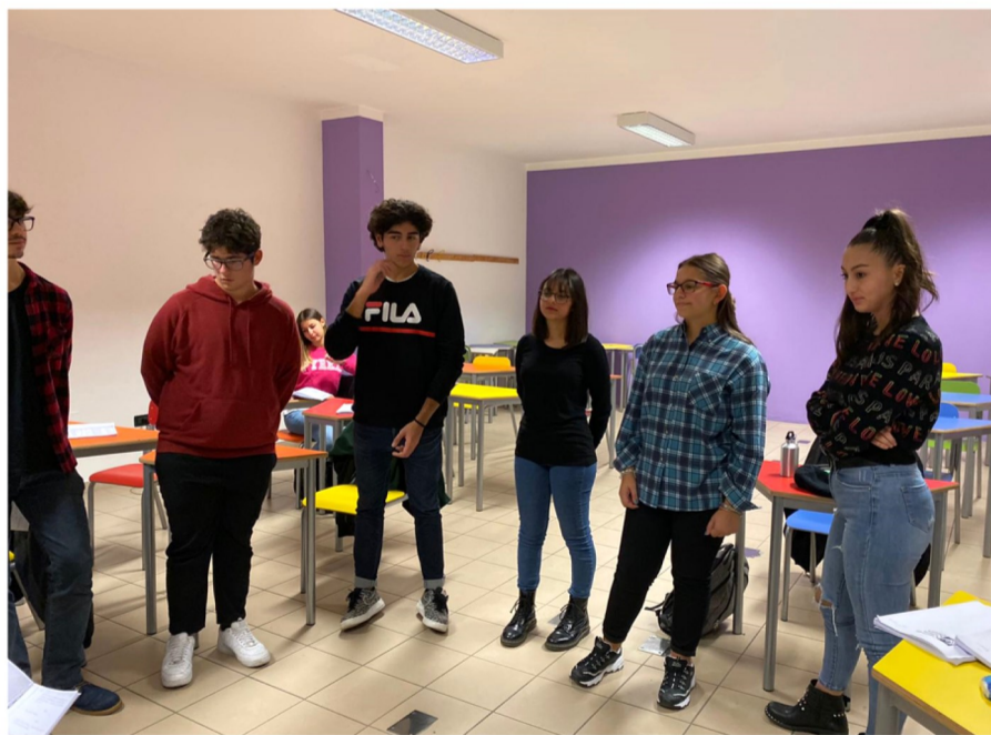
Alunni del Righi durante le prove teatrali 2019

Il teatro può essere considerato interdisciplinare perché contiene il gesto, la parola, il suono, il movimento e l'immagine. Il teatro rappresenta un espe-