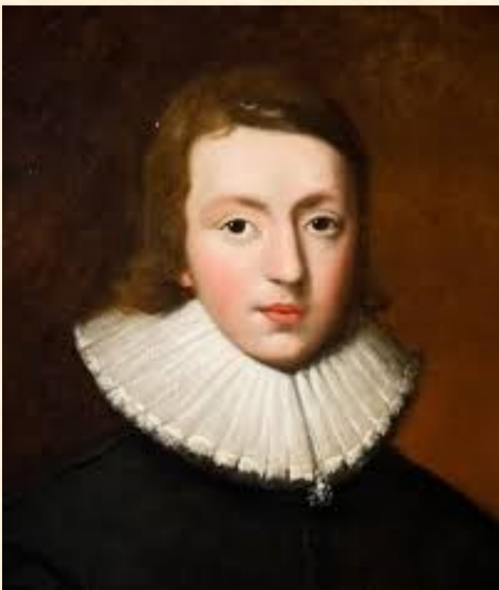
John Milton (Londra, 9 dicembre 1608 – Londra, 8 novembre 1674). La critica gli attribuisce una profonda conoscenza dell'Inferno dantesco.

docenti e ata, rappresentano la più sicura base dalla quale recuperare la fiducia nel futuro: questo secondo numero del nostro TecnoRighi (che conclude la sua seconda annata di pubblicazione) ne è la testimonianza tangibile. L'impegno corale di docenti e studenti nel riportare fatti, eventi e testimonianze di questo anno di scuola spiega più d'ogni altra cosa il senso intrinseco del valore di ciò che siamo. Per questo, nonostante non sia sempre agevole, non smettiamo di credere in noi stessi e nella nostra convinta motivazione ad andare incontro al futuro e alle prossime sfide che ci attendono. Nel ringraziare tutta la comunità scolastica per l'impegno profuso nell'attività di insegnamento come nell'attività amministrativa mai interrotta, adesso non resta che sperare di recuperare la "normalità" delle nostre vite e riprendere la tessitura della trama di incontri umani ed esperienze, rinnovati dalle nuove competenze consolidate in questo anno. Nessuno può procedere proficuamente nel suo cammino senza lo sforzo di uno sguardo proteso in avanti, anche quando le nebbie sono fitte.