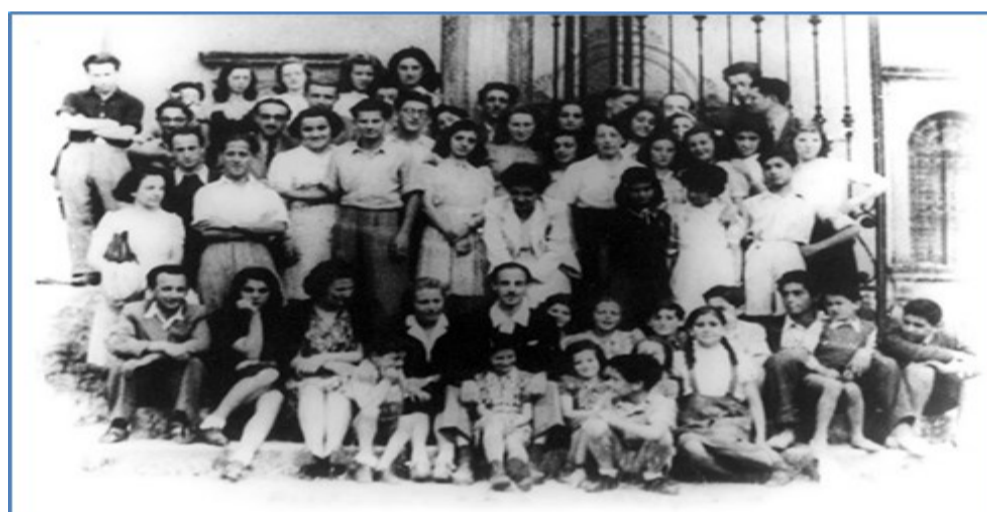
Foto scattata ai ragazzi ebrei di Villa Emma a Nonantola nel 1942